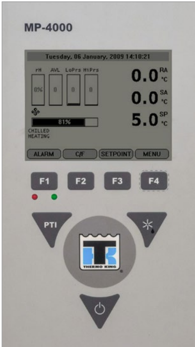
Main display with keyboard

To change the controller setpoint complete following steps: